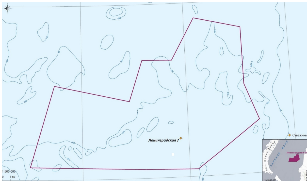
Рисунок 1 – Обзорная схема района работ

Участок шельфа, на котором планируется размещение проектируемой скважины, расположен на удалении около 98 км от берега вдали от населенных пунктов.