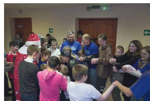
В детском доме всегда рады гостям и общению

Дети также подготовили для гостей небольшую концертную программу: пели песни, танцевали и играли на музыкальных инструментах. Итогом встречи стало угощение ребят в столовой (кстати, с собой коллеги привезли домашнюю выпечку) и вручение подарков. Одними из самых желанных подарков стали ноутбуки: эта техника была крайне необходима интернату для обучения воспитанников компьютерной грамотности. Отметим, что на собранные работниками «Газпром недра» средства приобретено два ноутбука, всего же их подарили десять – достаточно, чтобы обновить компьютерный класс.