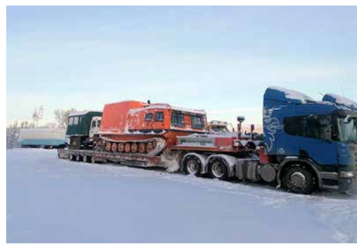
Мобилизация техники в Якутии