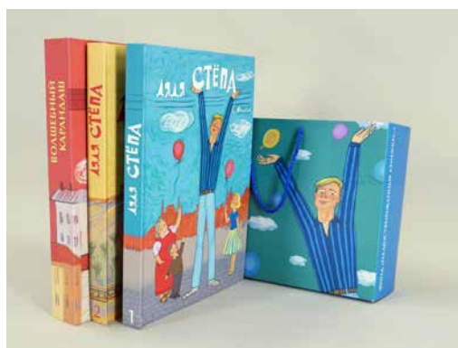
Уникальные книжные комплекты для слабовидящих детей