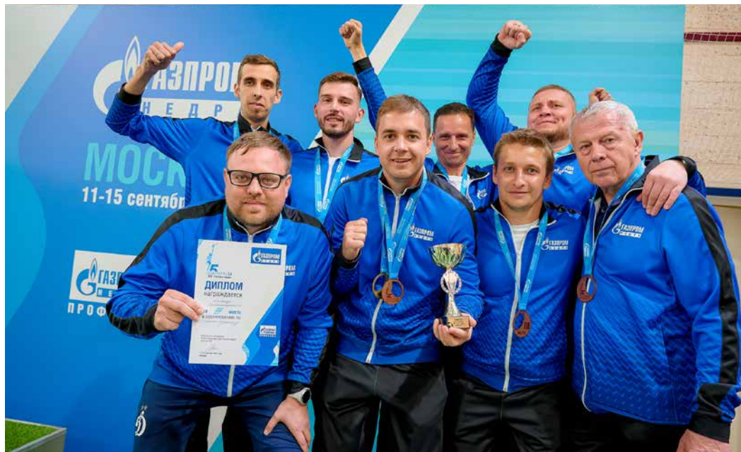
Команда Администрации ООО «Газпром недр» по мини-футболу