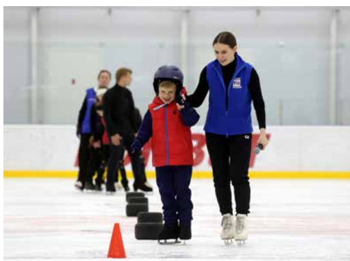
Инклюзивная секция адаптивного фигурного катания «Хрустальные пазлы»