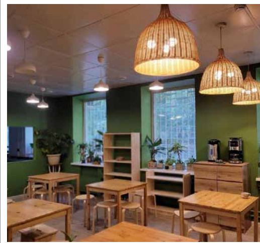
Уютное и безопасное место для подопечных фонда