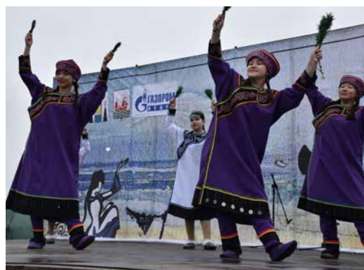
Праздник «Кормление духа – хозяина моря» на острове Сахалин