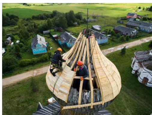
Спасение деревянных памятников Русского Севера