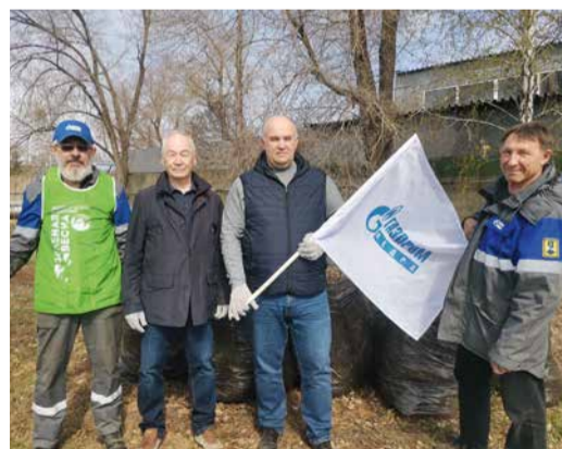
«Зеленая весна» в Оренбурге