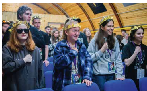
Программа выездной учебы включала 46 мероприятий различной направленности