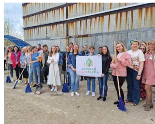
Участники субботника в Ухте