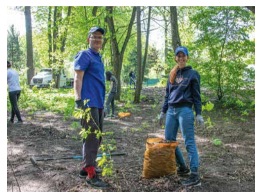
Субботник на станции юных натуралистов уже стал традицией для наших московских коллег