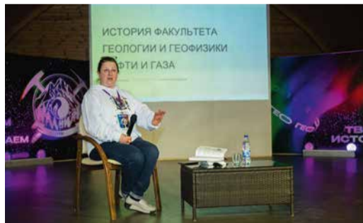
Для студентов были организованы лекции и мастер-классы экспертов