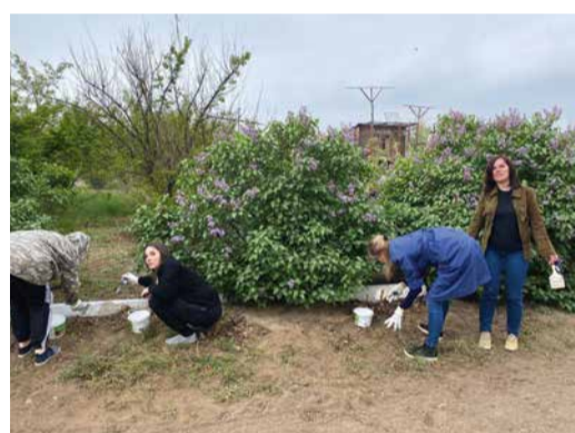
Коллеги в Астрахани одними из первых вышли на субботник