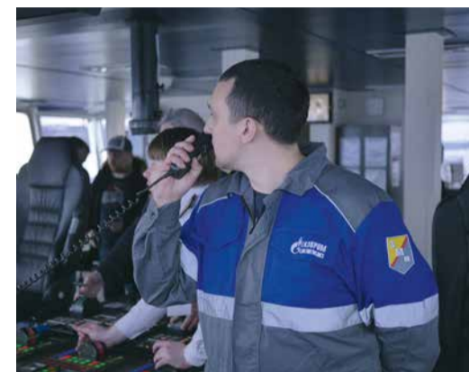
Мероприятие организовано компанией «Газпром недра»

Комплексное учение, согласно действующему законодательству, впервые организовано компанией «Газпром недра» до начала навигационного сезона. Оно предваряет утверждение «Плана предупреждения и ликвидации разливов нефти и нефтепродуктов при проведении геологоразведочных работ на арктическом шельфе». Государственная комиссия по оценке учения признала представленные организацион-