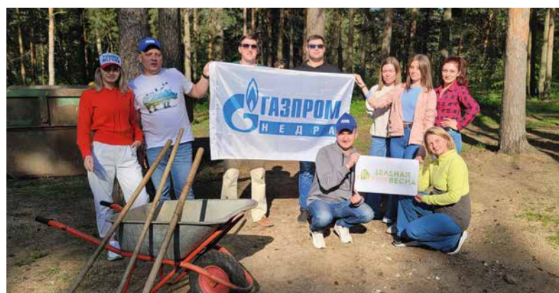
Коллеги из Раменского на субботнике у озера «Гидра»