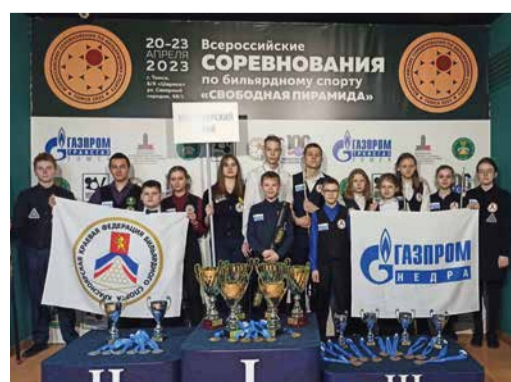
Команда юных бильярдистов Красноярского края