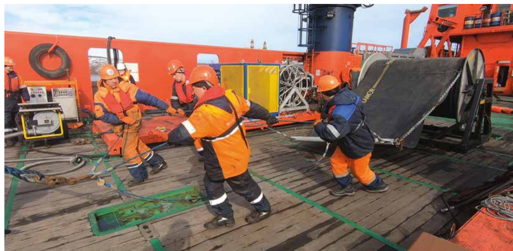
Развертывание нефтесборных систем