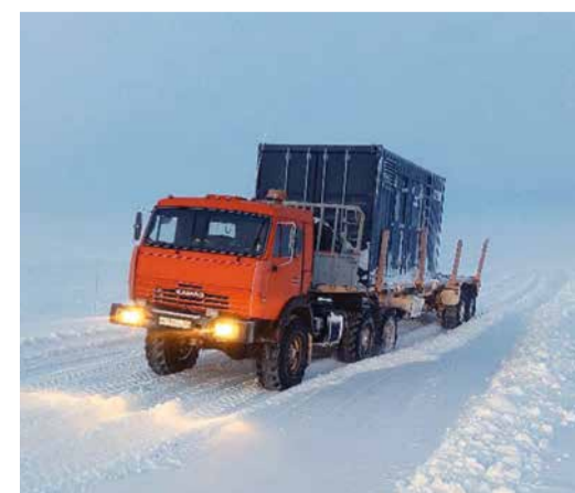
Зимний завоз является важнейшим звеном в цикле геологоразведочных работ

Под строительство скважин и дорог произведена отсыпка около 350 тыс. куб. м грунта. Кроме того, компанией организована демобилизация порядка 350 тонн грузов с площадок, где уже полностью завершено разведочное бурение.