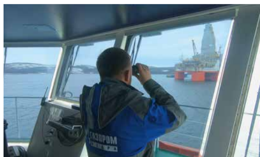
БУДЬТЕ В КУРСЕ В преддверии навигационного сезона организовано учение в Кольском заливе стр. 3