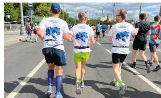
СПОРТИВНАЯ ВЕСНА Наши коллеги стали участниками Московского полумарафона стр. 8