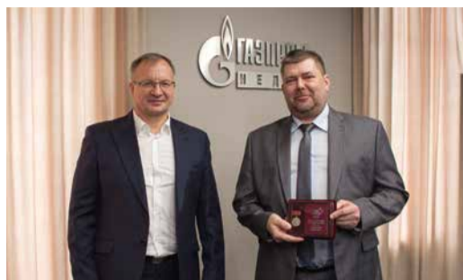
75 ЛЕТ ТЮМЕНСКОЙ ГЕОЛОГИИ Юбилейными памятным медалями награждены 16 работников компании стр. 2