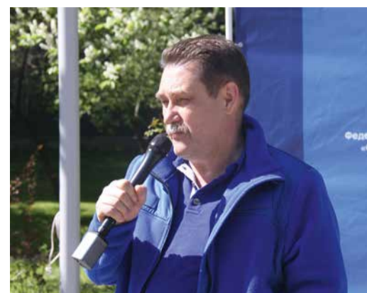
Вячеслав Плотников поприветствовал участников субботника в Москве