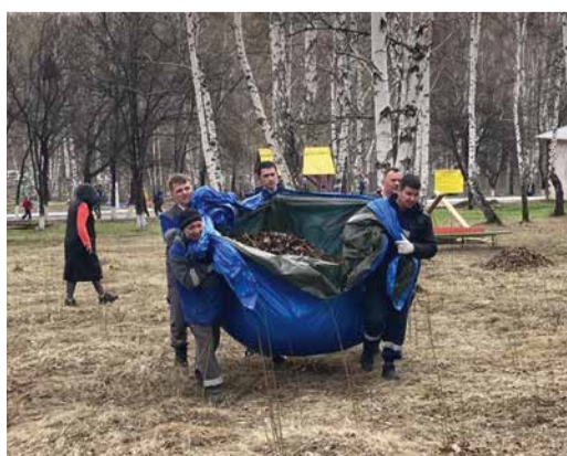
Иркутяне привели в порядок территорию детского дома