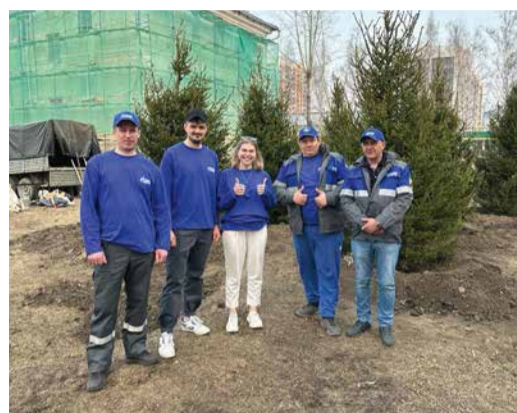
Пять больших елей украсили Монумент Славы в Новосибирске