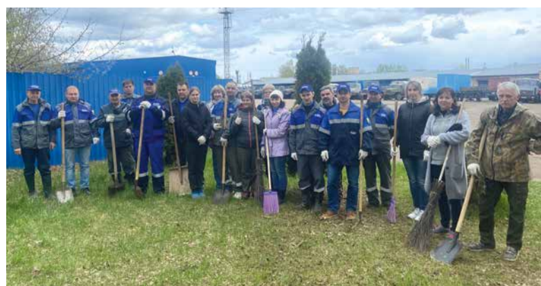
«Зеленый десант» в Костроме