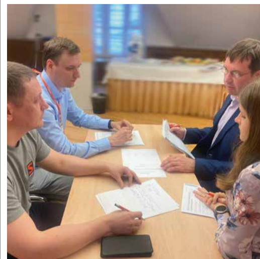
Мероприятие включало много групповых заданий