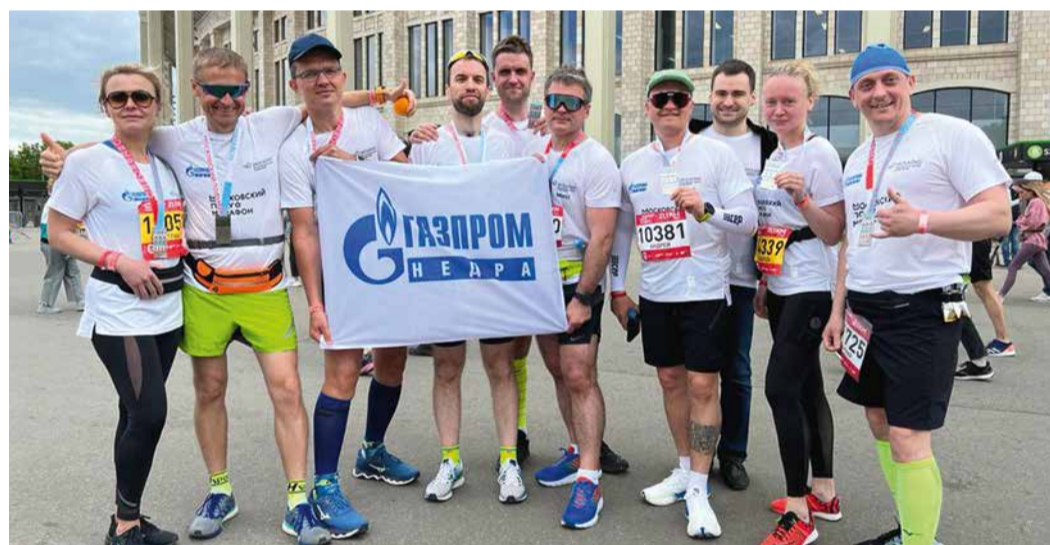
Участие в Московском полумарафоне сплотило коллег из Москвы и Тюмени

«Я был рад тому, что забег поддержали не только коллеги по работе, но и мои единомышленники из Школы управления Сколково, и ее логотип мы тоже нанесли на футболки. Наша компания пропагандирует как активный образ жизни, так и стремление к получению новых знаний. Таким образом, участие в масштабном полумарафоне дает