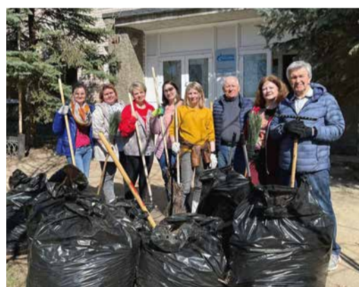
Участники субботника в Кимрах