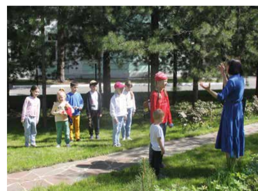
Экскурсия для детей сотрудников администрации компании в Москве