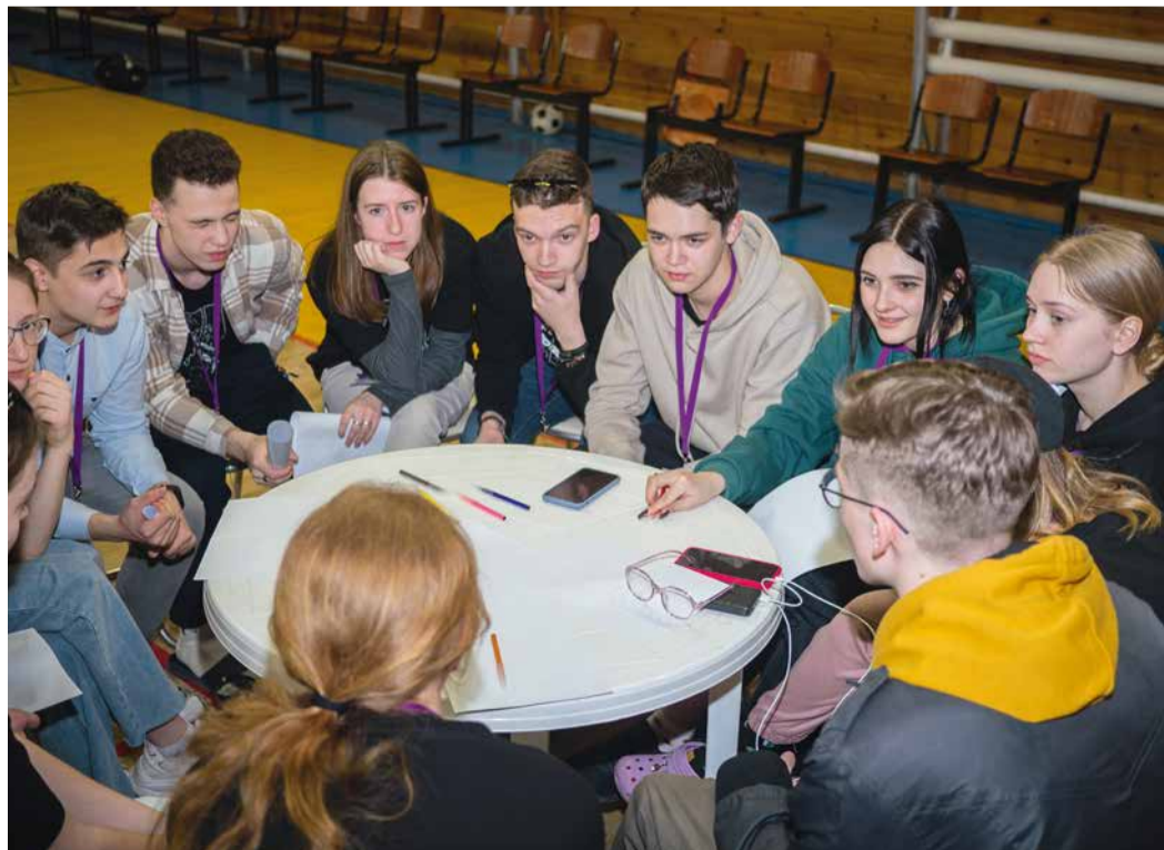
Интеллектуальные состязания – обязательная часть выездной учебы