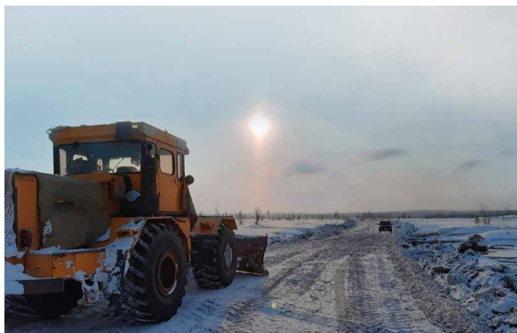
К работам было привлечено более 400 единиц спецтехники и автотранспорта

В ходе строительства разведочной скважины выполнен запланированный комплекс геолого-геофизических работ и исследований, отобран керн из чорской свиты, дана оценка развития коллекторов парфеновского горизонта.