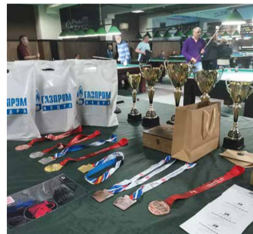
В турнире «Енисей-Батюшка» участвуют ветераны бильярдного спорта

За медали, дипломы различных степеней и ценные призы соревновались спортсмены из 14 регионов страны. В этом году турнир, собравший почти в два раза больше участников, чем годом ранее, проходил в особенно упорной борьбе. Отметим, что наша компания на протяжении уже нескольких лет оказывает поддержку Красноярской Краевой Федера-