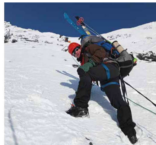
В горах Приполярного Урала