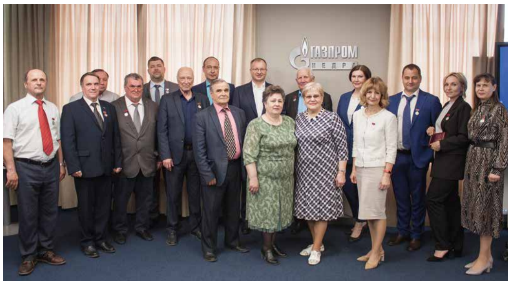
Наградами отмечены 16 представителей компании