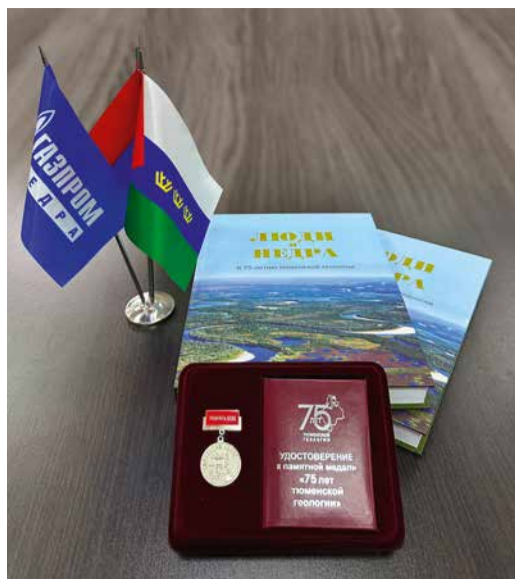
Памятная медаль и юбилейный двухтомник