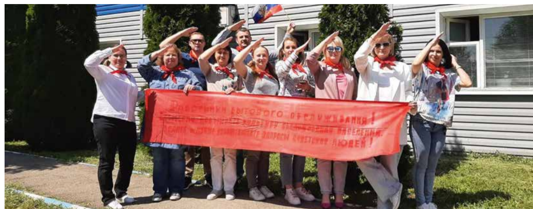
Один из субботников саратовцы приурочили ко Дню пионерии