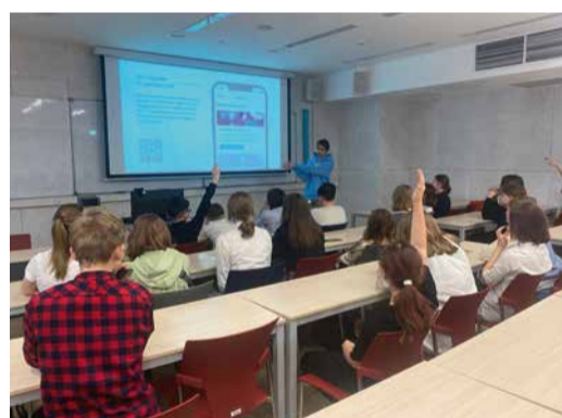
Молодые лекторы доходчиво рассказывали участникам об основах востребованных специальностей