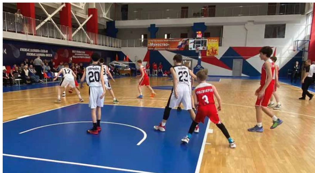
Соревнования прошли на баскетбольной арене спортивного комплекса в Красноярске