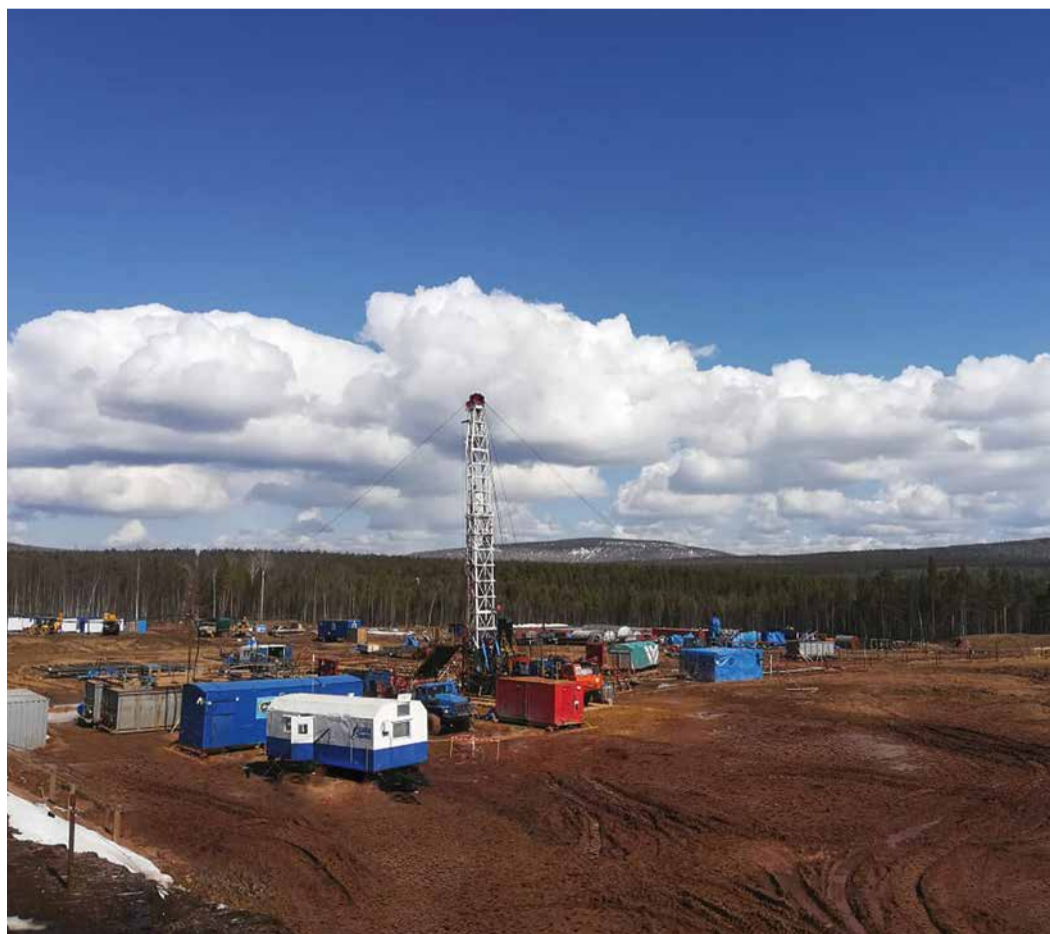
Геологоразведочные работы на Чиканском лицензионном участке