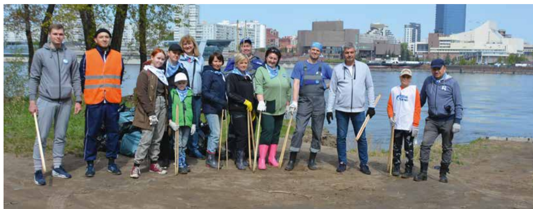
Красноярские коллеги навели порядок на живописном участке острова Молокова