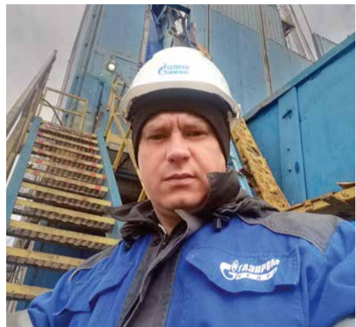
На Вуктыльском месторождении

Мы, в свою очередь, заинтересовались некоторыми фактами из биографии нашего ухтинского коллеги, а расспросив лидера конкурса подробнее, узнали о нем еще много нового и интересного.