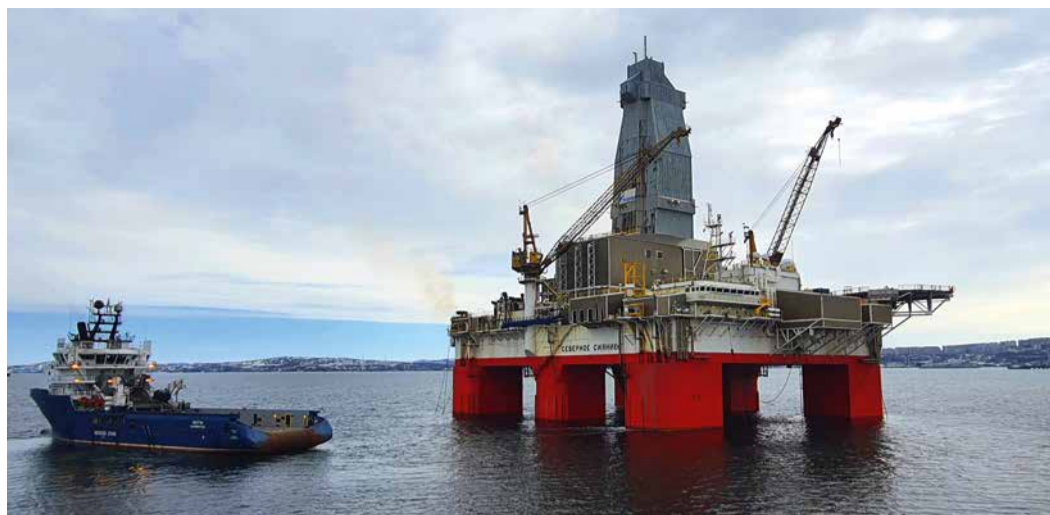
В новом навигационном сезоне ППБУ «Северное сияние» будет мобилизована на арктический шельф