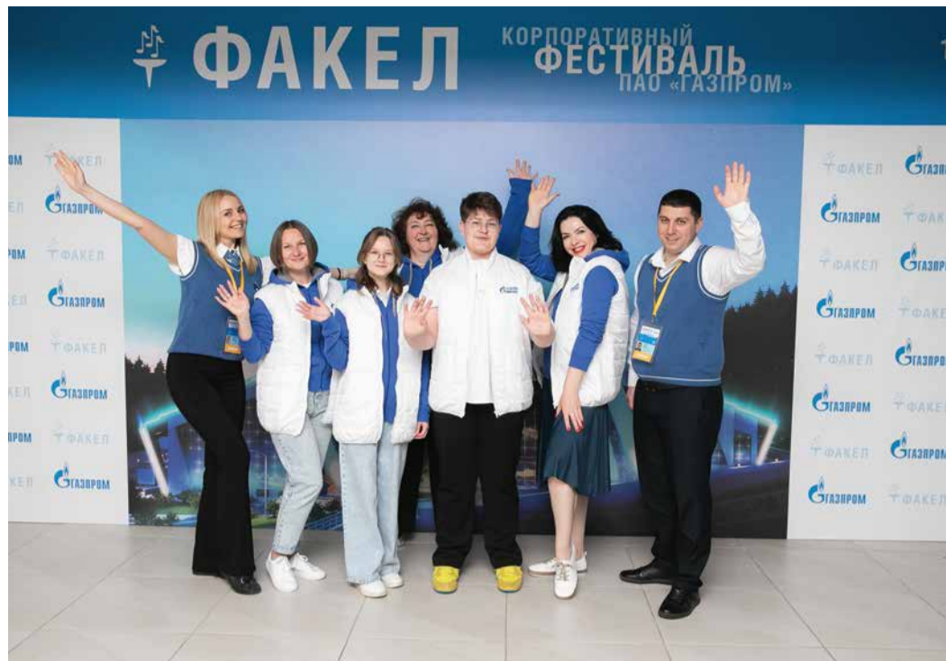
Делегация компании со своими кураторами